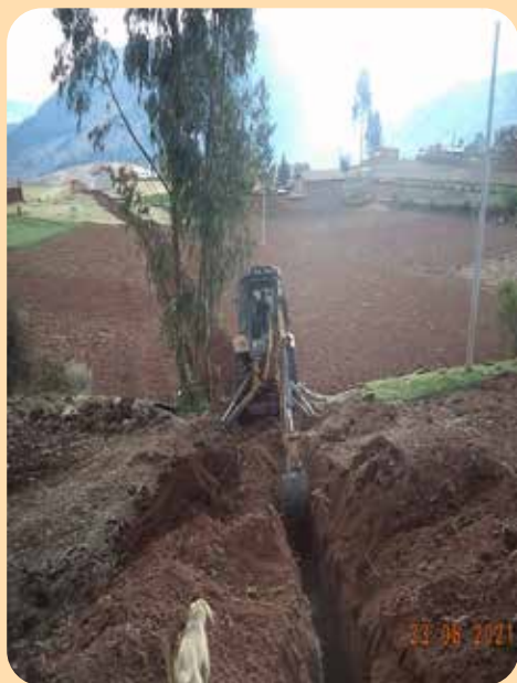
Arrivée des tuyaux et et excavation pour la ligne principale