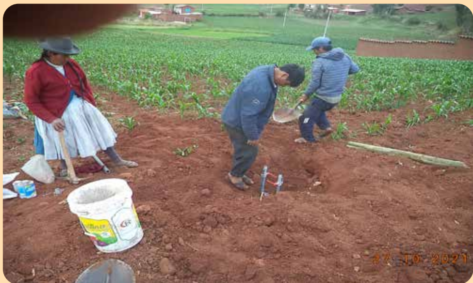
Les tuyaux de raccordement pour les asperseurs près des champs de maïs qui attendent l'irrigation