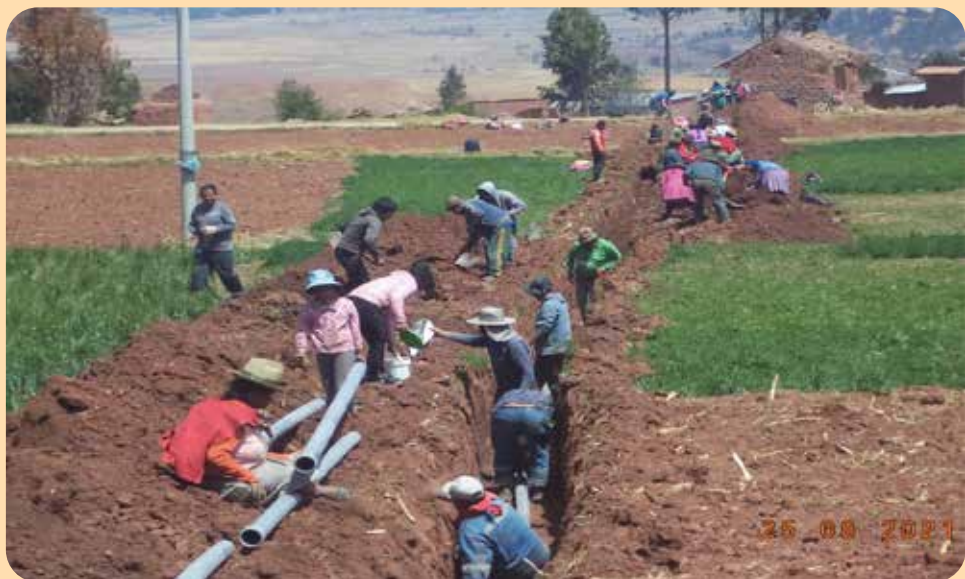
Toute la population aide à la pose des tuyaux