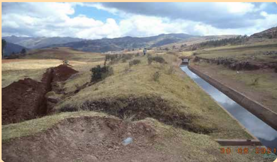
Le canal existant venant du lac Huaypo qui fournit l'eau pendant toute l'année auquel on a raccordé la ligne principale