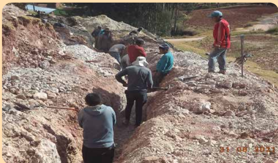
Pour traverser les endroits rocheux il faut beaucoup de mains fortes fournies par les bénéficiaires