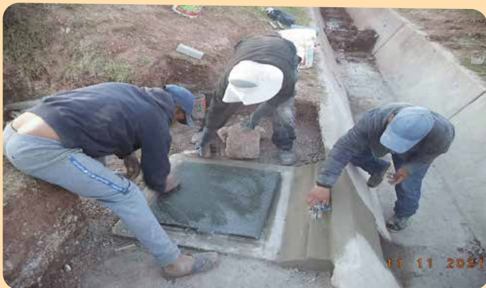
Le regard du raccord canal-tuyau obtient sa finition