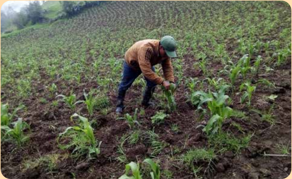
Les plantes de maïs se développent sur le terrain-pilote